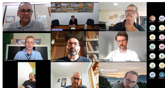
Câmara Setorial reuniu-se virtualmente.

Representantes do setor expressaram entusiasmo com as iniciativas, destacando o potencial da erva-mate para promover a preservação ambiental e alavancar a economia local por meio de projetos inovadores e sustentáveis.