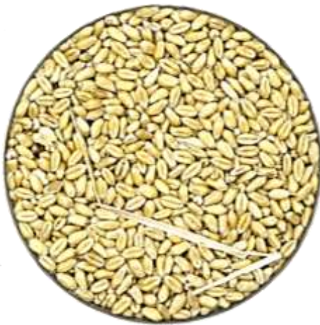
Figura 4: Fotos de grãos de trigo após processo de limpeza.

Somente com a integração de todas as ferramentas, chegaremos no resultado desejado. Todos devem colaborar.