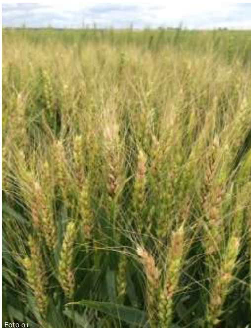
Figura 1: Fotos de espigas de trigo infectadas por giberela.

A DON é conhecida como Vomitoxina, causadora de problemas de saúde em animais e humanos devido a sua ingestão na dieta. Por se tratar de uma questão de saúde humana e animal, o consumo de trigo e seus subprodutos, como farinhas, massas e outros com presença de DON, tem sido tema de debate nos principais países produtores e consumidores de trigo em todo o mundo. O tema dessas discussões é a definição de limites máximos toleráveis (LMT) de consumo de DON e medidas de manejo para redução em pré e pós-colheita.