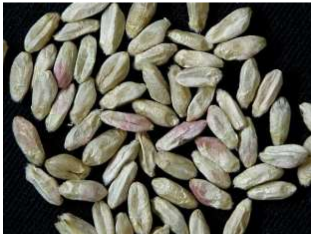
Foto 07

Geralmente as unidades de beneficiamento de grãos estão equipadas com máquinas de pré-limpeza. São sistemas que atuam por peneiramento: são retiradas as impurezas maiores e menores, independente do peso e por aspiração, através de um ventilador, são retiradas as impurezas mais leves através. Esse sistema tem auxiliado na redução dos grãos infectados pela giberela quando o lote apresenta pouca quantidade de grãos infectados. É necessário, realizar o repasse de um lote nesse equipamento quando o mesmo apresentar grandes quantidades de grãos infectados, sempre avaliando a troca de peneiras (tamanhos) e a carga do equipamento, para melhorar a eficiência de descarte de grãos não desejáveis.