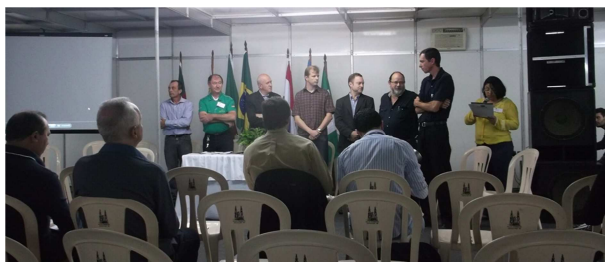
Abertura do II Congresso Estadual de Sustentabilidade.

Para cada tema foram apresentadas palestras abordando a temática, seguido de seção de perguntas e debates relativos aos assuntos apresentados.