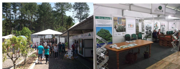
Feira Reunião grande público local e regional. Estando do IBRAMATE foi destaque na feira, onde a CSEM se fez presente.

O evento contou ainda com diversas outras atrações, como oficina de gastronomia, lançamento de nova marca de cerveja de Erva-mate e os estandes das Ervateiras e do IBRAMATE no pavilhão do chimarrão, dentre outras.