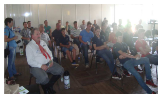
Palestras contaram com significativo público.