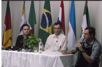
Embrapa e consultor para negócios internacionais estiveram entre os palestrantes, participando de debate após suas explicações.

Nos dias 13 a 15 de novembro ocorreu, no município de Ilópolis a 7ª Turismate.